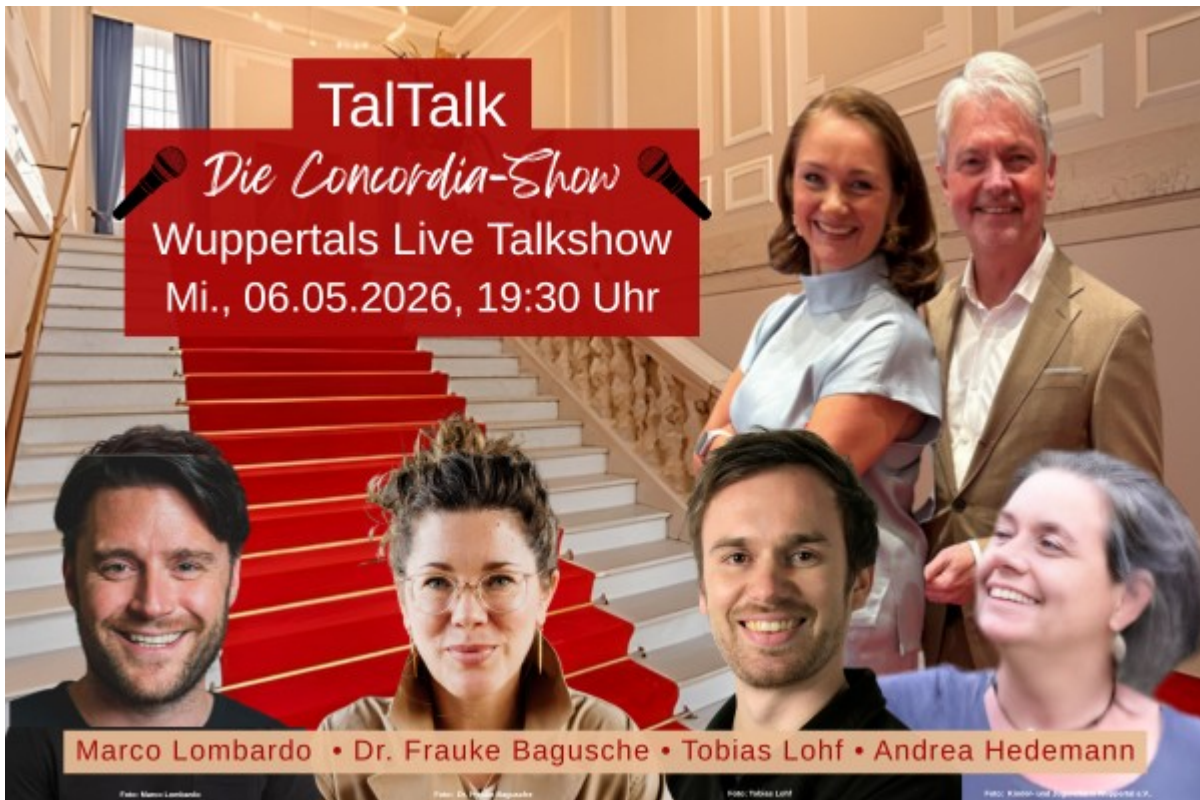
Plakat zum Event